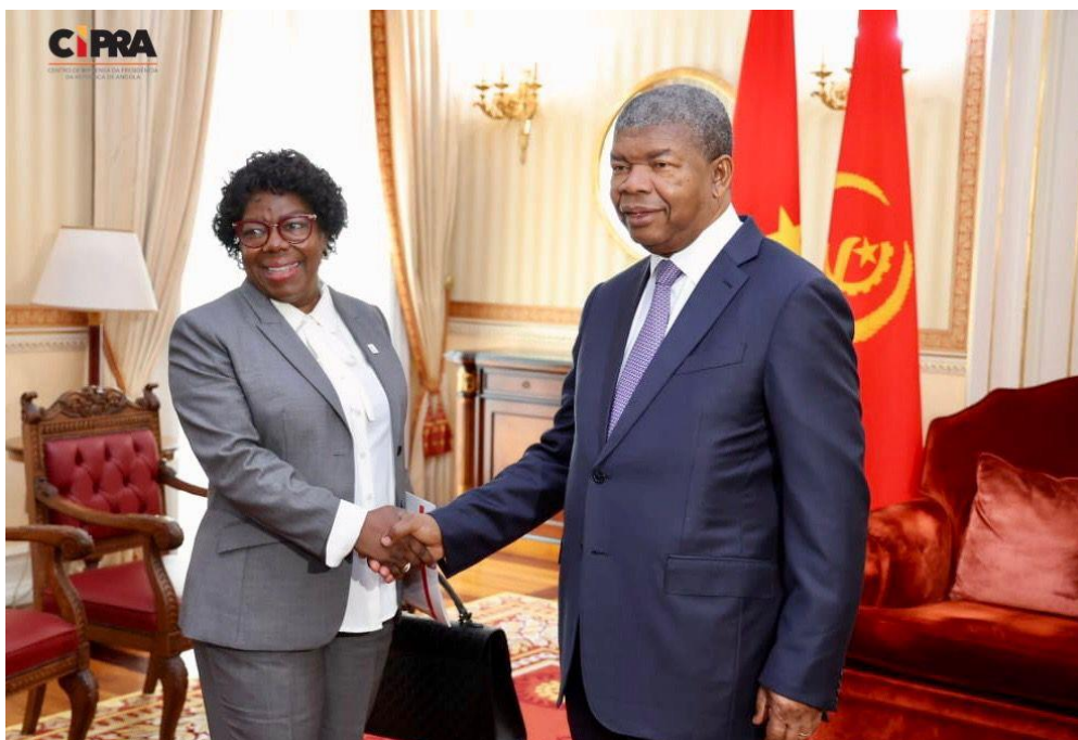
Figura 1 Encontro da Presidente da CVA e o Presidente da República de Angola