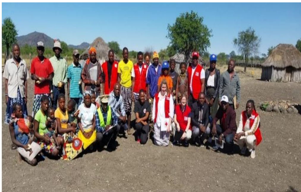
Figura 5 Visita da Cruz Vermelha do Canada para avaliação do DREF