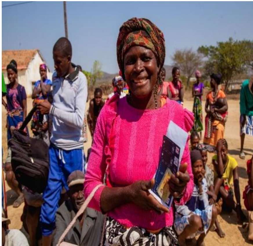
Figura 7 Entrega do Apoio do CASH - Sul do País