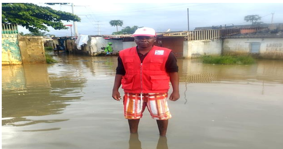
Figura 2 Impacto das cheias-Malange