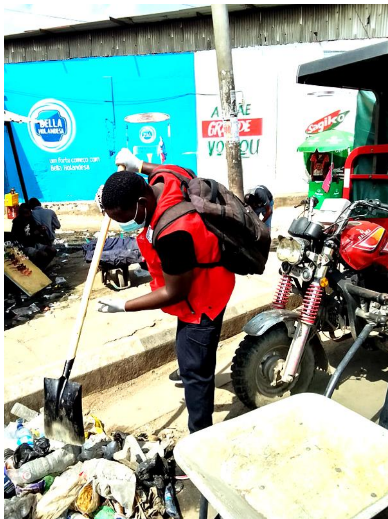
Figura 2 Campanha de Limpeza-Luanda