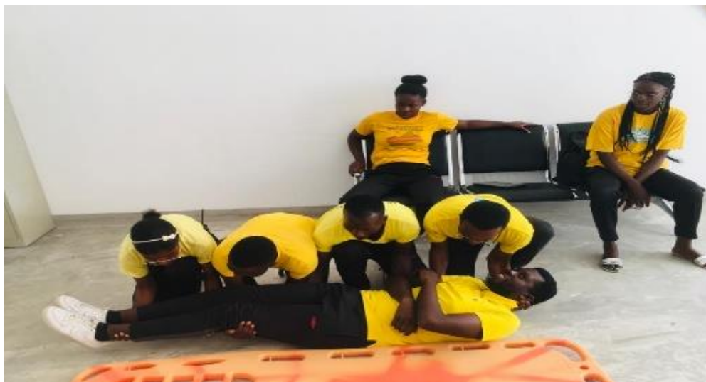
Figura 3 Treinamento de Primeiros Socorros-Huíla