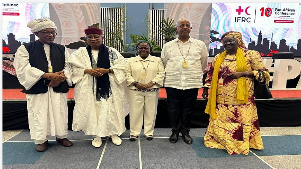
Figura 8 Participação na Conferência do PAN Africano