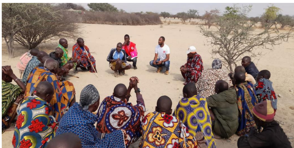
Figura 6 Formação de Grupos focais na Comunidade