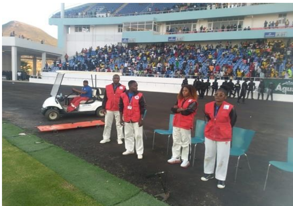
Figura 4 Assistência em capo de football-Huíla