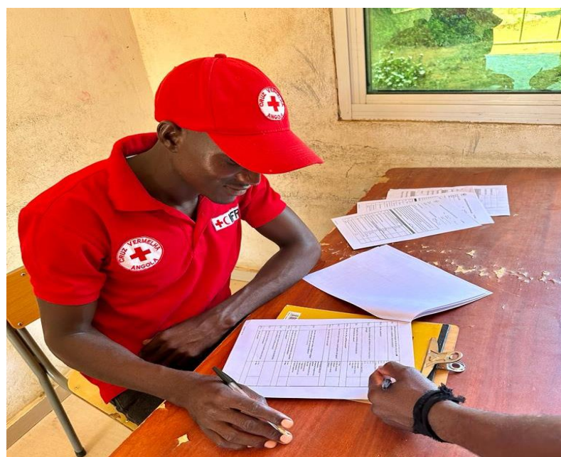
Figura 3 Monitoria Pos-Distribuição-Namibe