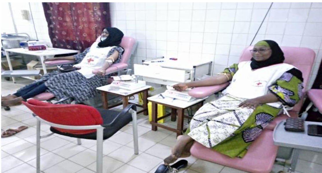
Photos : don de sang des volontaires de la CRN