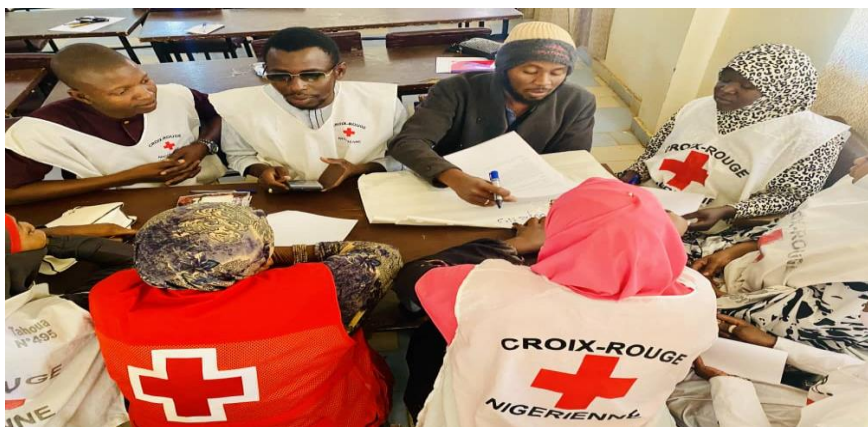
Exercice de groupe des volontaires à la session de formation au DIH