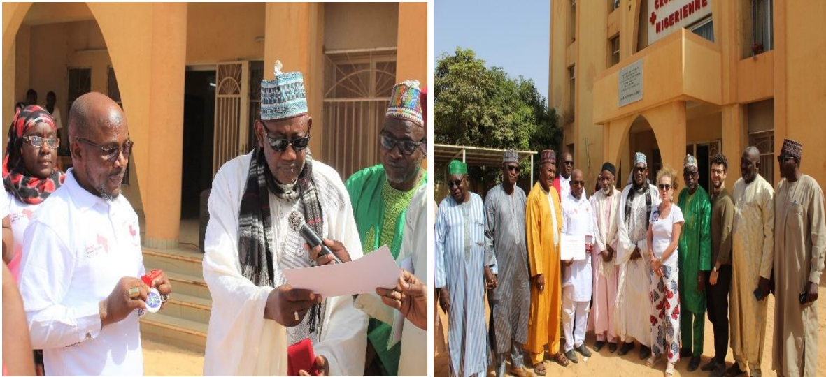
Photos : cérémonie médaille d'honneur RLF