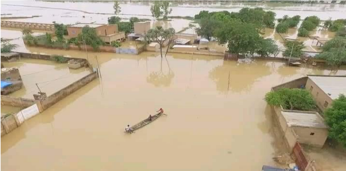
Photos : vu du ciel l'étendue des dégâts liés aux inondations