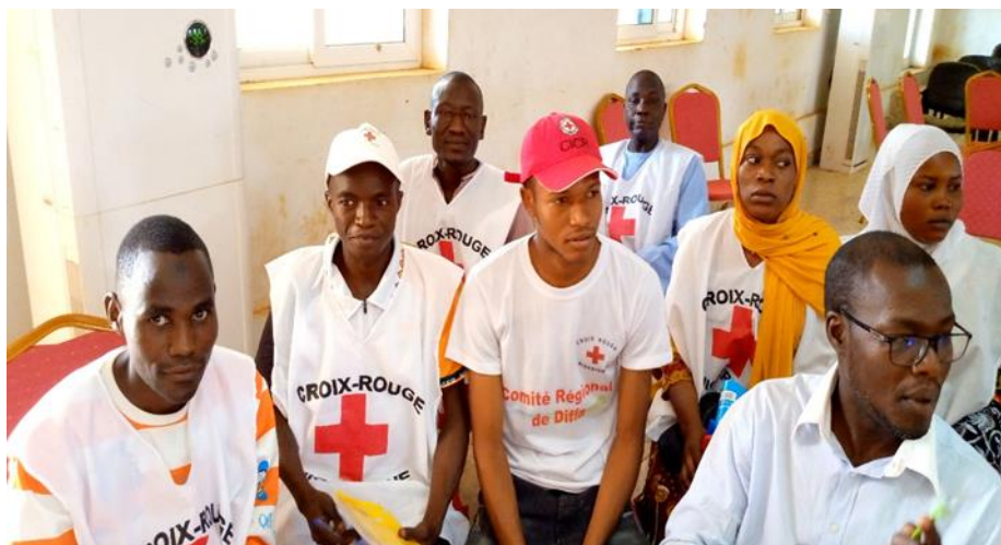
Une vue des participants à la formation