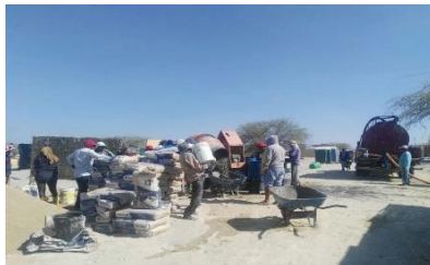
Elaboración de las losas