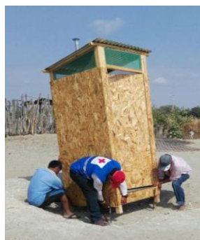
Instalación de letrinas y lavaderos en cada uno de los alojamientos