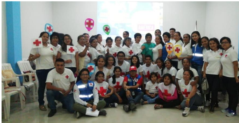
Formación Básica Institucional – Tumbes