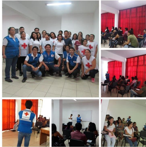
Charla de inducción de FBI – Filial Ica