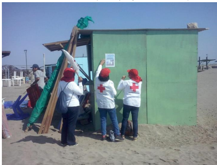
Servicio Preventivo sobre cuidado de Playas - Chiclayo