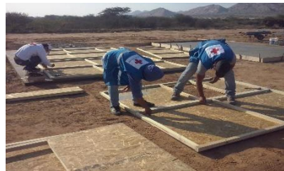
Implementación de los alojamientos (Asistencia técnica y actividad comunitaria)