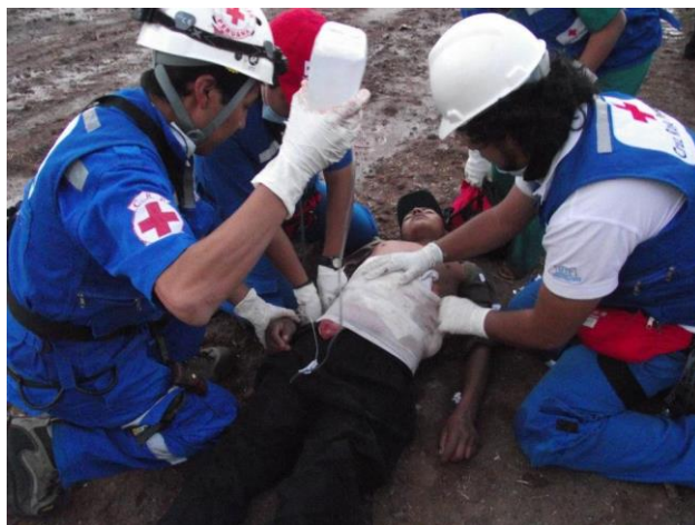
Atención Pre-hospitalaria (Terreno)