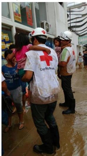
Atención Fenómeno del Niño 2017