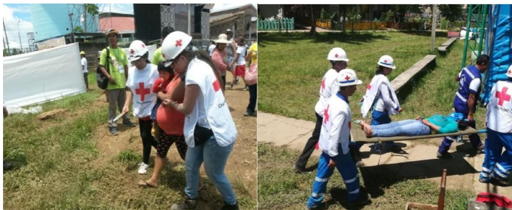
Servicio Preventivo Visita del Papa Francisco

orientación ante Migraciones. También se ha reforzado el cerco perimétrico del local con apoyo de materiales de un voluntario.