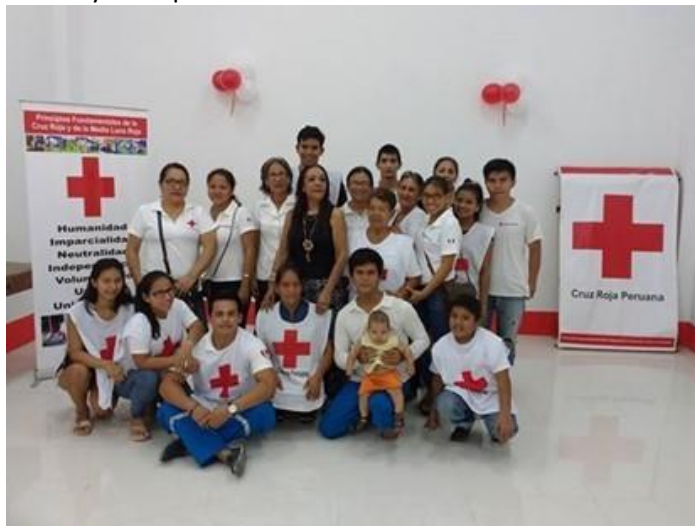
Capacitaciones a Voluntarios Filial Maynas