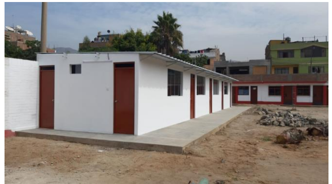
Proyecto de Violencia de género con CRE / Construcción de Consultorio CRE