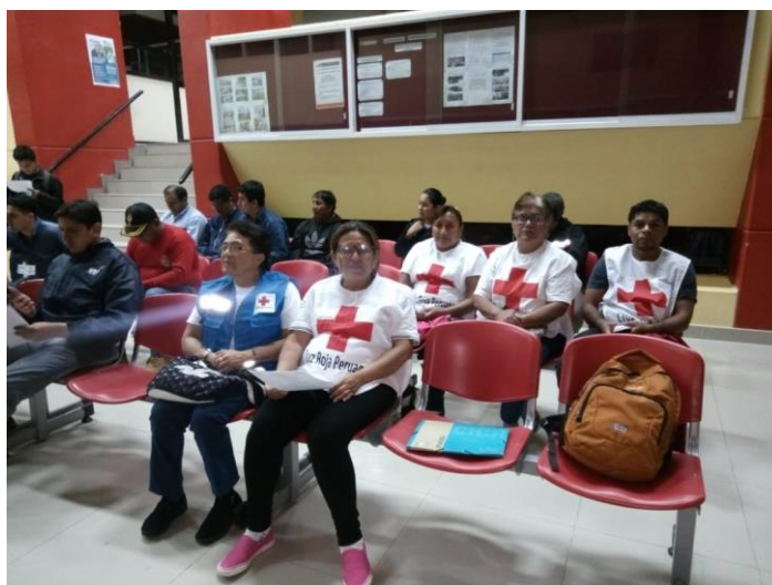
Participación de reuniones técnicas equipos de Primera Respuesta - Talara