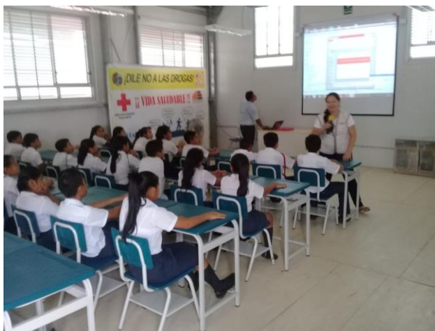
Micro proyecto – Proyecto de Fortalecimiento Institucional