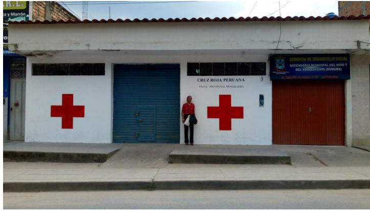
Local recuperado por nuestra Presidenta Nacional