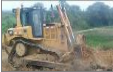
Movimiento de Tierra (Municipalidad)