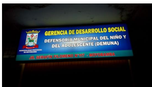
La municipalidad Posicionada en el local de Cruz Roja Peruana