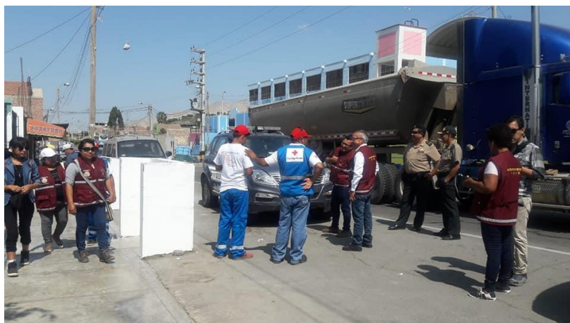
EDAN Huancano - Pisco