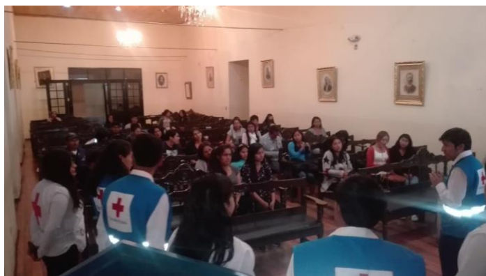
Captación de Nuevos Voluntarios – Ayacucho

cedieron terreno y nosotros hemos construido el segundo piso. Con la nueva gestión la Presidenta Nacional han aceptado el ofrecimiento de anular la Resolución y vuelva la Cruz Roja. Próximamente estarán inaugurando la escuela de Primeros Auxilios.