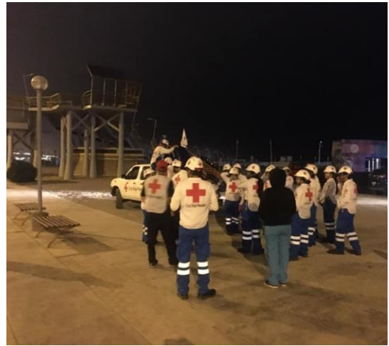
Servicios Filial Lima