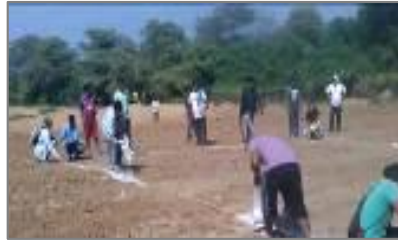
Compactación y trazado del terreno (Asistencia técnica y actividad comunitaria)