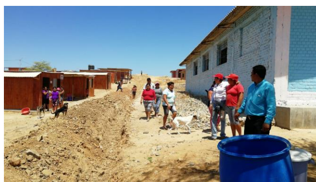
Acciones por el Fenómeno del Niño - Piura