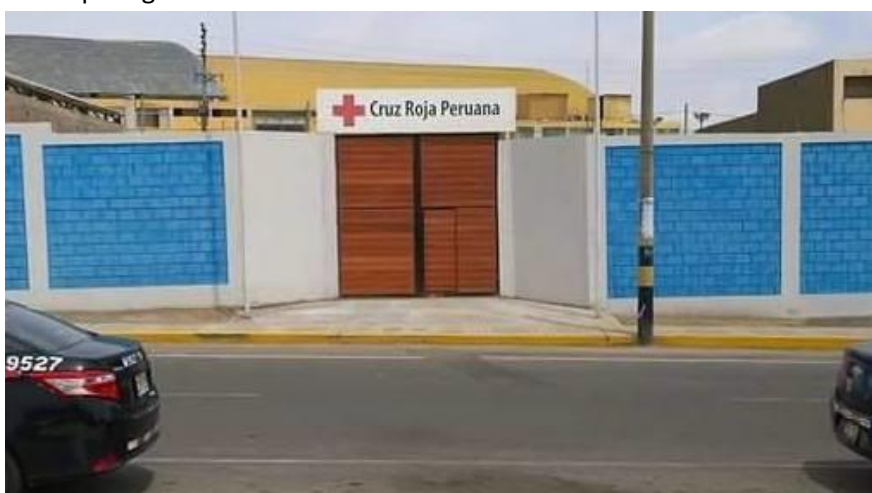
Frontis del local de la Cruz Roja Peruana Filial Tacna