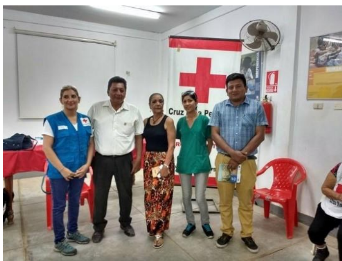
Reunión con equipo de Gestión

Mantienen una participación activa en la red de coordinación para la preparación y respuesta a desastres liderado por la DDI INDECI Ucayali, y también en el COER.