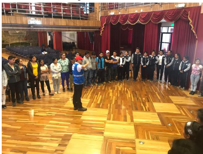
Formación Básica institucional –Filial Abancay