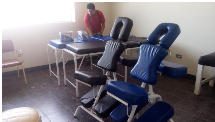
Materiales comprados con el Micro-proyecto del Adulto Mayor