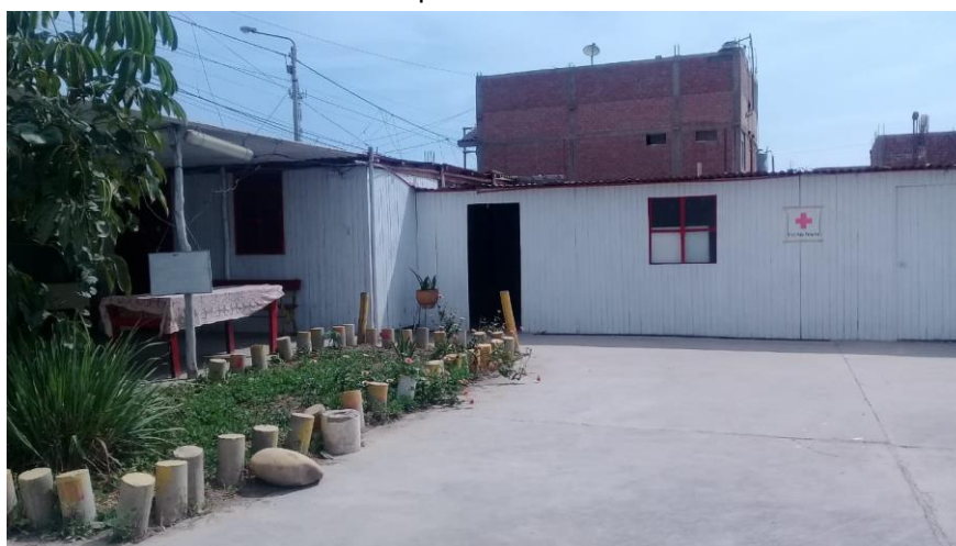
Auditorio de la Filial Huarmey