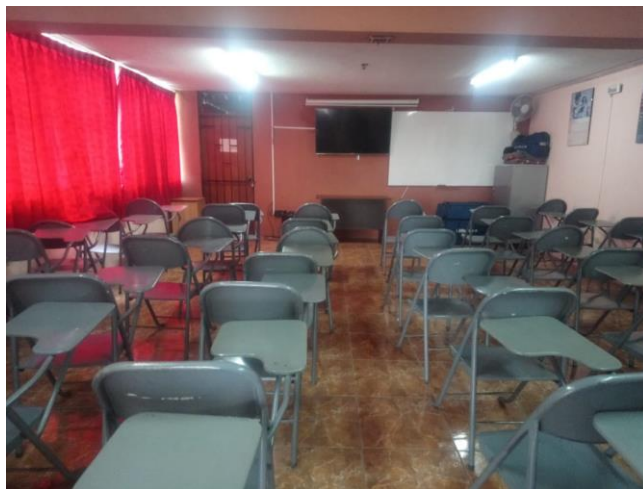
Mejoras de las instalaciones de Filial Arequipa – SN – CRA – CRPfa