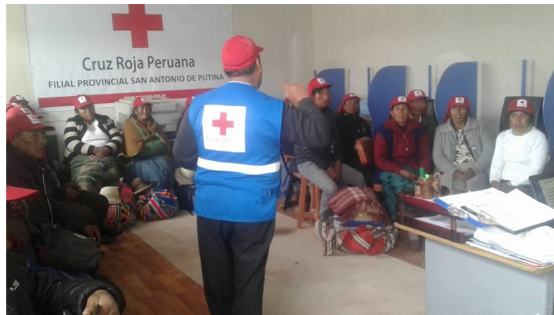
Capacitación a Líderes Comunales

Están realizando gestiones para la Escuela de Capacitación.