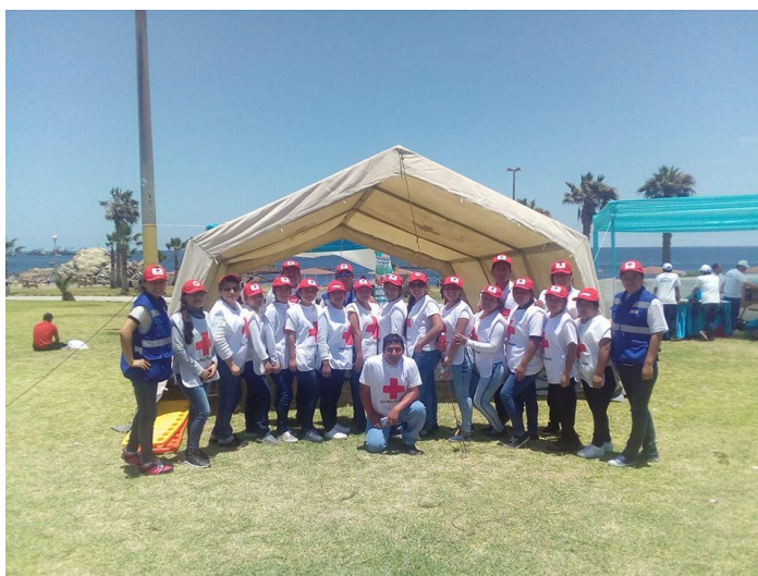
Servicio Preventivo Voluntarios Filial Ilo