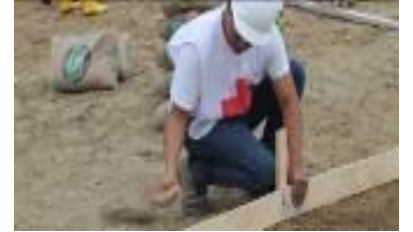
Encofrado de losas (Asistencia técnica)